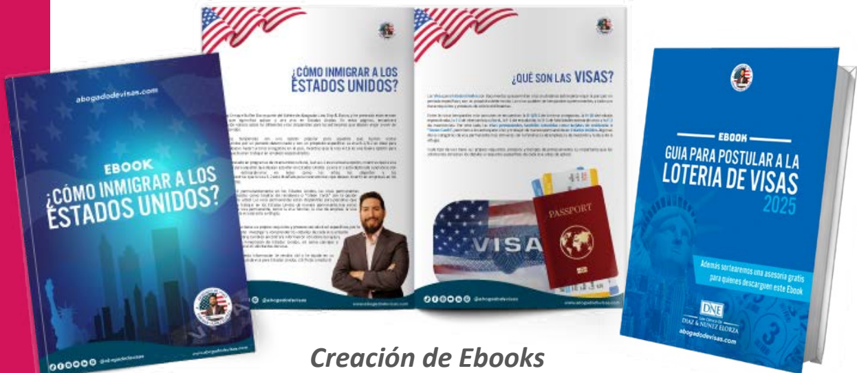
Creación de Ebooks